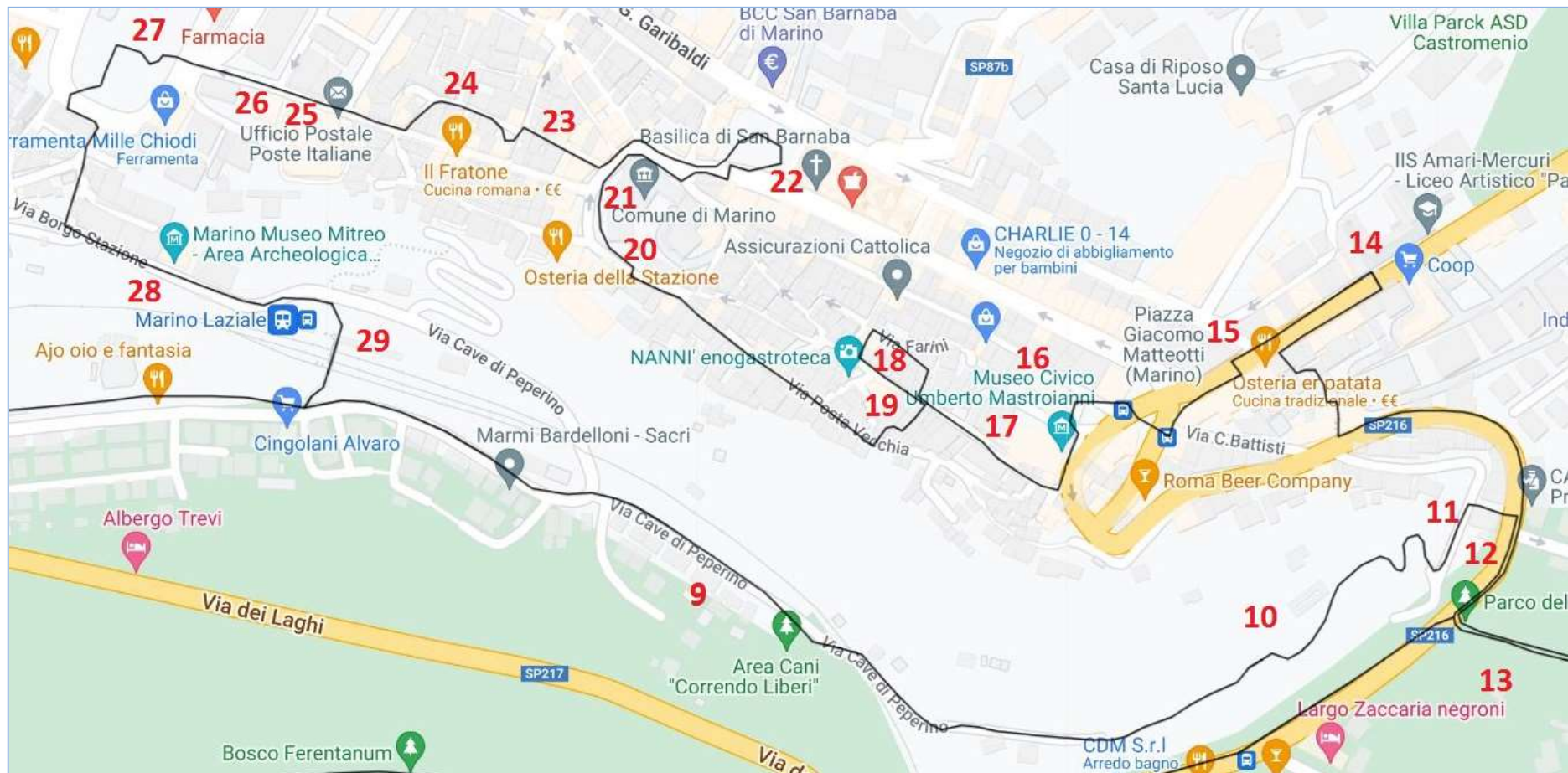
Itinerario all'interno del centro storico di Marino